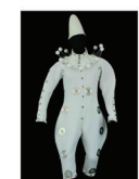
Costume de Clown Blanc conçu par Rémy Moreau et réalisé par Catherine Moreau, Rémy Moreau, Clément Moreau, 2008