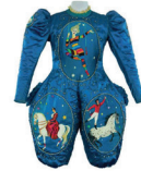
Costume de Vicaire Fratelli (1879-1901) en feu de sac bleu avec des motifs peints.